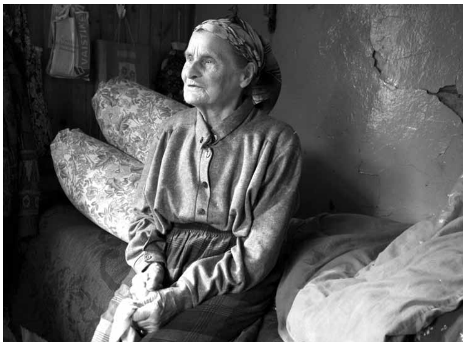
Ant savo lovos prie atrupėjusio „pečiaus“. D. Vaitkevičienės nuotrauka, 2010