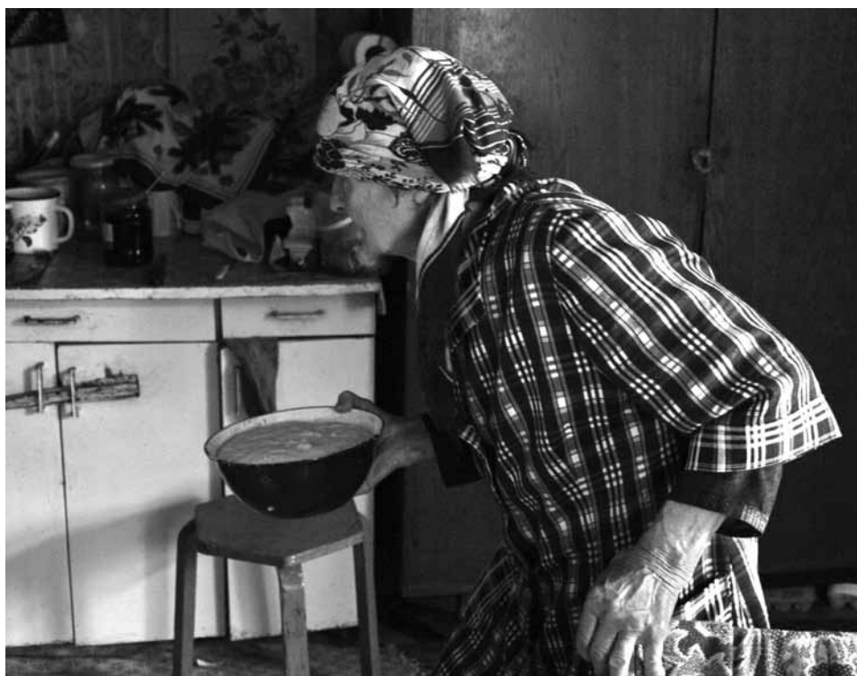
Ruošiasi kepti „pončikus“. D. Vaitkevičienės nuotrauka, 2010