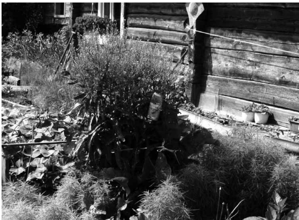
„Kvietkas“ palei langą. D. Vaitkevičienės nuotrauka, 2010