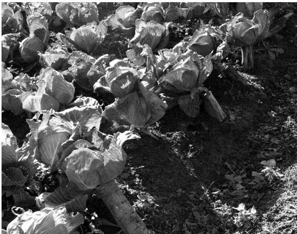
Malkomis paremtos kopūstų galvos. G. Šmitienės nuotrauka, 2010